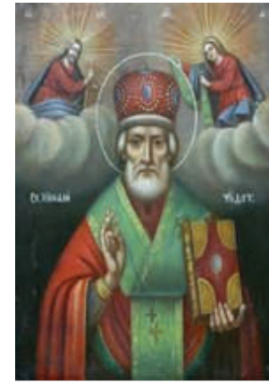
San Nicolas de Myra