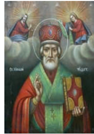
San Nicolas de Myra