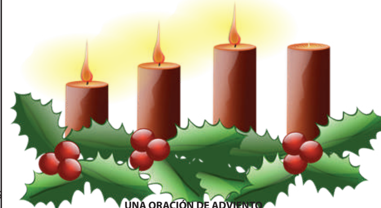
UNA ORACIÓN DE ADVIENTO

Miranos, Jesús, y deja que toda la oscuridad de nuestras almas desaparezca ante los rayos de tu brillo. Llénanos con tu santo amor y ábrenos los tesoros de tu sabiduría. Conoces todos nuestros deseos, así que lleva a la perfección lo que has comenzado y lo que el Espíritu Santo nos ha despertado para pedir en oración. Buscamos tu rostro, volteamos tu rostro hacia nosotros y nos muestran tu gloria. Entonces nuestro anhelo será satisfecho y nuestra paz será perfecta. Amén. -St. Agustín de Hipona