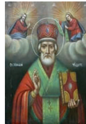
San Nicolas de Myra