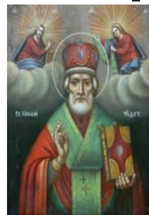
San Nicolas de Myra