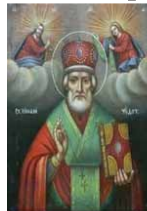
San Nicolas de Myra