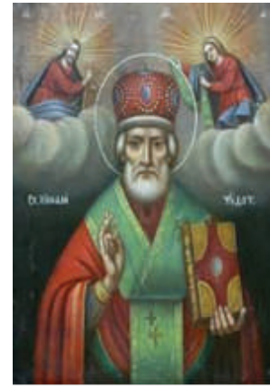
San Nicolas de Myra