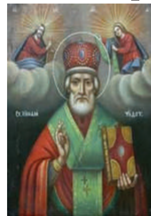
San Nicolas de Myra